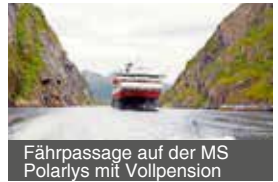
Fährpassage auf der MS Polarlys mit Vollpension